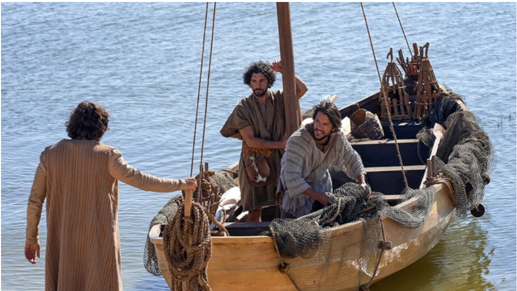
Jeesus kutsuu kalastajaveljekset Pietarin ja Andreaan seuraajikseen suoraan työn keskeltä. Pietarin taustatarina The Chosen -sarjassa tarjoaa selityksen sille, miksi hän piti itseään niin syntisenä, että pyysi Jeesusta menemään pois luotaan.

- Siitä se ajatus lähti: vapauttaisiko Jeesus minutkin? "Vain yksi jakso..." Vähänkö minä tiesin.